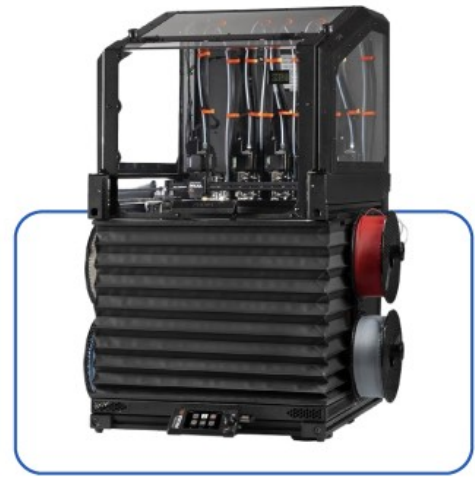
Prusa XL + Enclosure